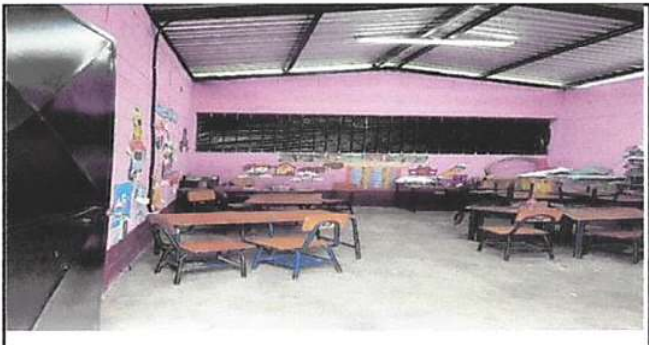
Piso cerámico, repello y cernido en paredes, instalación de ventanas pvc.