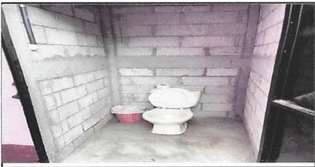
Sustitución de Sanitario.

Observación: Si es necesario se pueden agregar hojas adicionales y actualizar el registro de fotos.