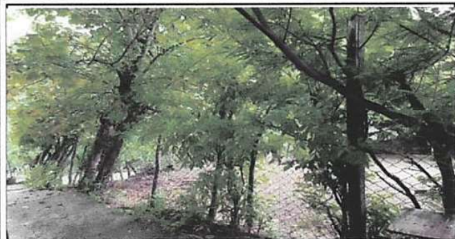
Levantado de muro perimetral.