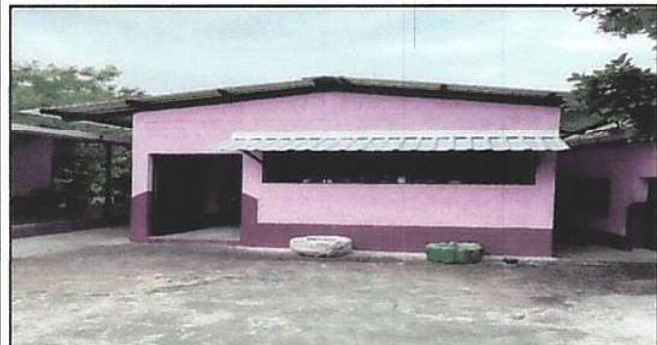
Construcción de Galera.