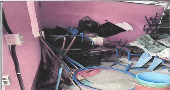
Piso cerámico, estufa rural, reparación de sistema eléctrico.